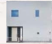
外観 SCANDIA 内装 ANTICO

ナチュラルな色味のかわいいシンプルな北欧風のおうち。 玄関からホールまでのアプローチが広く、 趣味のものを置いておけるスペースも確保。 収納も家事動線も考えられた暮らしやすい間取りです。