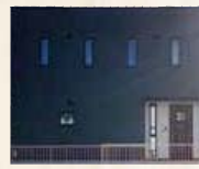
外観 ANTICO 内装 JAPONE

◇敷地面積 / 207.71㎡ (62.83坪) ◇延床面積 / 113.45㎡ (34.31坪) (1F 61.28㎡ 2F 52.17㎡)